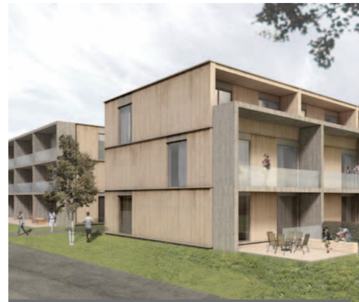
Planung mit Stoffpass: Der im Projekt untersuchte Wohnungsneubau in München