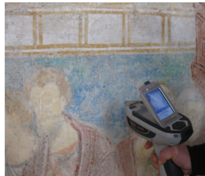
Südwand, Untersuchung zu Pigmentveränderungen mittels Röntgenfluoreszenzanalyse (RFA)

Die Schaffung stabiler Raumklimaverhältnisse setzt voraus, dass zunächst ein Rahmen definiert wird, innerhalb dessen sich die Raumluftfeuchte und die Raumtemperatur im Tages- und Jahresverlauf bewegen sollten. Mithilfe geeigneter Klimaparameter, die aus archivierten Daten und Simulationsberechnungen sowie neuartigen Untersuchungsmethoden entwickelt wurden, gelang es, einen optimal auf den jeweiligen Raum angepassten, tolerierbaren Klimabereich für die Krypta und die Kirche abzuleiten. So ist es auf denkmalgerechte Weise möglich, das anzustrebende Raumklima in der Kirche St. Georg herzustellen und das Risiko einer weiteren Beschädigung der Wandmalerei zu minimieren. Die im Rahmen dieses Forschungsvorhabens gewonnenen Erkenntnisse in Bezug auf Untersuchungsmethoden, Maßnahmenkonzepte und präventive Raumkonditionierung können auch für vergleichbare Problemstellungen in individuell abgewandelter Form adaptiert werden.