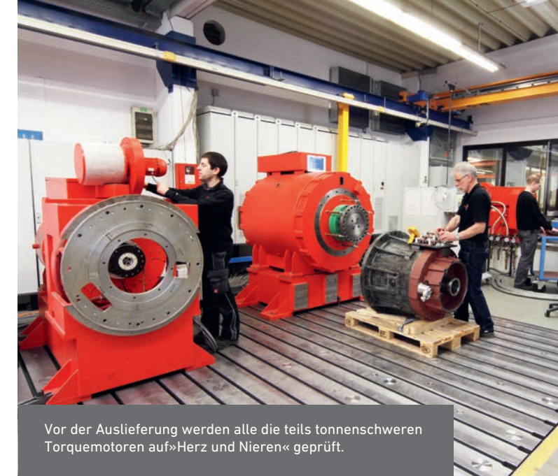
Vor der Auslieferung werden alle die teils tonnenschweren Torquemotoren auf »Herz und Nieren« geprüft.

Außerdem engagiert sich die Firma OSWALD im Forschungsfeld der »Hochtemperatur-Supraleiter-Technologie« – aktuell mit dem Ziel, supraleitende Motoren als Antriebe für große Flugzeuge zu entwickeln. Dazu kooperiert das Unternehmen mit zahlreichen Hochschulen und Forschungsinstituten im In- und Ausland. Durch die Verwendung von Supraleitungen können künftig kompaktere, leichtere und leistungsdichtere Antriebe gebaut werden, mit denen weitere Quantensprünge an Energieeinsparungen erreichbar sind.