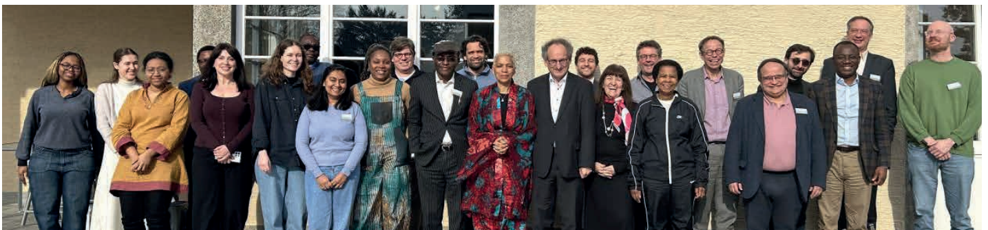
Die Teilnehmenden des Workshops »Wohlstand und nachhaltige Finanzen neu denken«

Im Rahmen eines Workshops des Zentrums für nachhaltige Wirtschafts- und Unternehmenspolitik an der Hochschule Darmstadt zum Thema »Wohlstand und nachhaltige Finanzen neu denken« wurde dieses Ergebnis bestätigt. Ziel des Workshops war es, ein Netzwerk von Forschern aufzubauen und dieses Netzwerk in ein Ökosystem von Experten einzubetten, um das Thema »Nachhaltige Finanzen« auch aus der bisher unzureichend berücksichtigten Perspektive des Globalen Südens zu diskutieren.