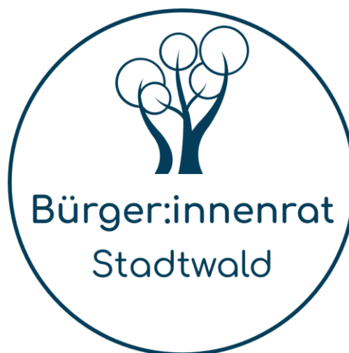
Abbildung 4: Logo für den Bürger:innenrat.

Hier beispielhaft das von der HNEE erstellte Logo für den Bürger:innenrat: