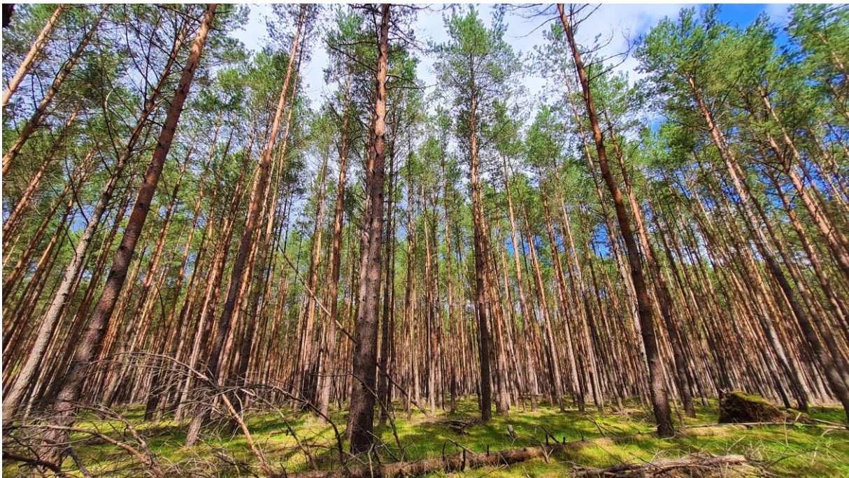
Abbildung 1: Kiefern im Stadtwald von Biesenthal (Brandenburg).

Gesamtziel unseres Vorhabens war vor diesem Hintergrund (1) die Durchführung (in Biesenthal) und (2) die inter-kommunale Verbreitung eines neuartigen partizipativen Beratungsprozesses über Handlungsalternativen – der im Unterschied zu üblichen Ansätzen sowohl die inhaltlich-wissenschaftliche als auch die politisch-soziale, konfliktreiche Komplexität von Waldmanagement-Konzepten in sachgerechter und legitimer Weise anzugehen vermag.