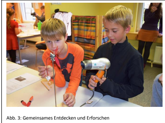
Abb. 3: Gemeinsames Entdecken und Erforschen