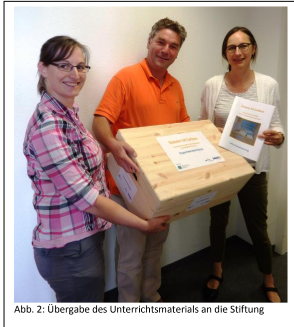
Abb. 2: Übergabe des Unterrichtsmaterials an die Stiftung

Im Teilprojekt Lernpatenschaften wurden Kooperationen zwischen Sekundar- und Grundschulen initiiert und unterstützt. Schüler/innen der Sekundarstufe I werden in einem eigens entwickelten Energieunterricht (aus einem Vorgängerprojekt) zu Energieexperten ausgebildet und geben ihr Wissen dann bei Patenbesuchen an Grundschüler/innen weiter.