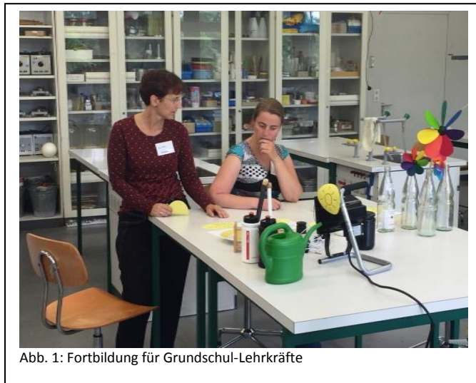
Abb. 1: Fortbildung für Grundschul-Lehrkräfte

Im Teilprojekt „Lehrerfortbildung“ wurde eine Fortbildungsreihe entwickelt und erprobt. Diese befähigt Grundschullehrkräfte, das Thema erneuerbare Energie erlebnisorientiert, lehrplangerecht und schulalltagsnah im Unterricht der Grundschule umzusetzen - sogar wenn die Lehrkräfte fachfremd unterrichten. Dabei liegt der Schwerpunkt auf der Weiterentwicklung der fachdidaktischen sowie fachwissenschaftlichen Kompetenzen der Lehrkräfte zum Thema erneuerbare Energie. Die Entwicklung erfolgte auf wissenschaftlicher Grundlage, und die Erprobung wurde im Projektzeitraum evaluiert. Die Fortbildungsreihe war zudem in der Metropolregion Rhein-Neckar zu bewerben und entlang der Schuljahre bzw. Studiensemester zu organisieren.