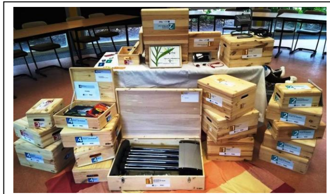
Abb. 4: Unterrichtsmaterial des Vorgängerprojekts „Zukunft gestalten“

Die Projektentwicklung von „Sonne ist Leben“ (Grundschule) baut auf dem erwähnten Vorgängerprojekt „Zukunft gestalten“ (Kita) auf und profitiert von dessen Vor-Erfahrungen. Dieses Vorgängerprojekt befindet sich seit Fertigstellung 2015 in Verbreitung durch die VRD Stiftung und ihre Partner. Dies betrifft die Projektentwicklung im Förderzeitraum ebenso wie die ab Herbst 2017 für die VRD Stiftung anstehende Überarbeitung, um das Material optisch ansprechend, langlebig und kostengünstig für Schulen produzieren zu können (Lehrerhandreichung, Arbeitsblätter, Boxen mit Experimenten und Lernspielen, Fortbildungskonzept). Rückmeldungen aus dem Vorgängerprojekt zeigen deutlich wie wichtig es ist, Zeit und Geld in ein optisch ansprechendes und Übersichtlichkeit vermittelndes Layout zu investieren.