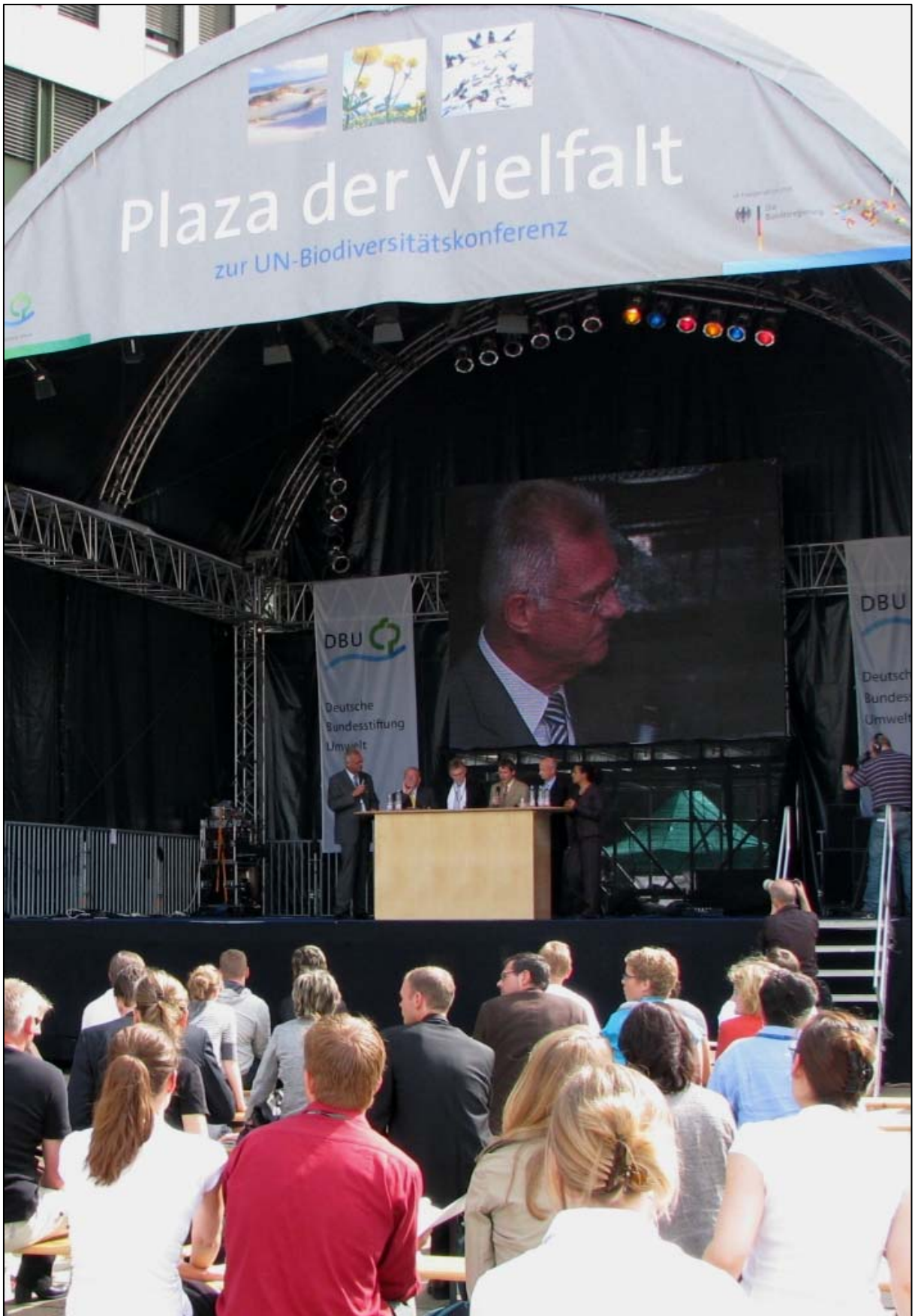
Abb. 4: Podiumsdiskussion „Preventing the irrecoverable loss: observing and inventoring our planet’s species“ beim „Forum der Vielfalt“.