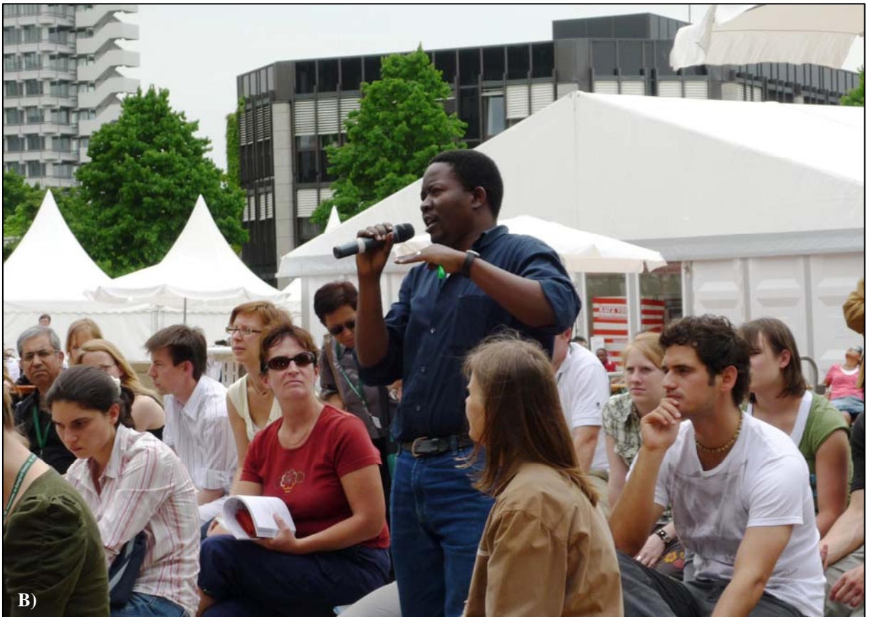
Abb. 5: A) Präsentation der Ergebnisse und der Empfehlungen der wissenschaftlichen Vorkonferenz auf dem „Forum der Vielfalt“ mit anschließender Diskussion (B).